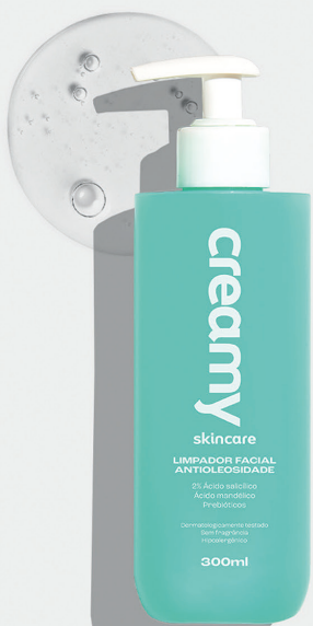
Limpador Facial Antioleosidade 300ml R$49,99 cada