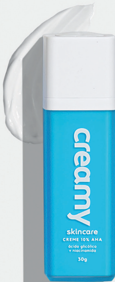
Ácido Glicólico 30g R$83,99 cada